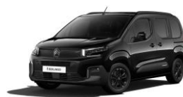
Negro Perla Nera