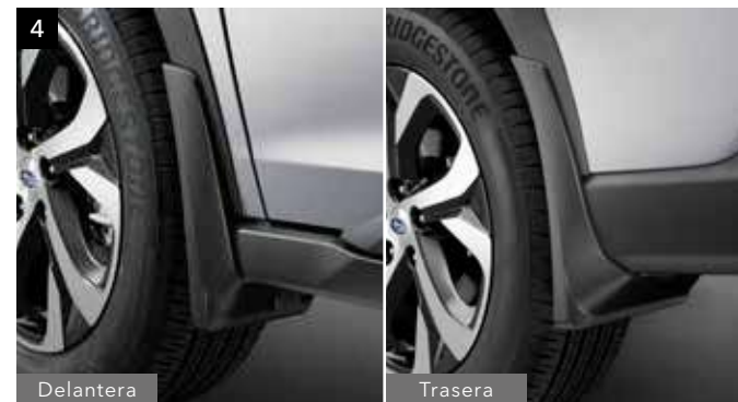
4 Kit faldillas

Mejora la apariencia del lateral e incrementa el aspecto off-road.