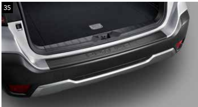
35 Protector zona carga paragolpes (resina negro)