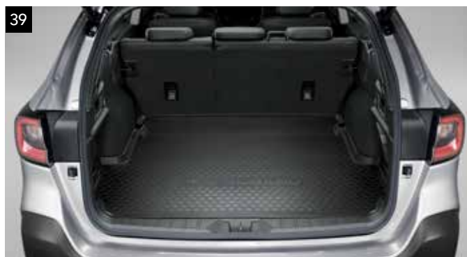
39 Protector maletero bajo

Ofrece protección adicional al piso y paredes de la zona de carga contra el polvo, la suciedad y los líquidos.