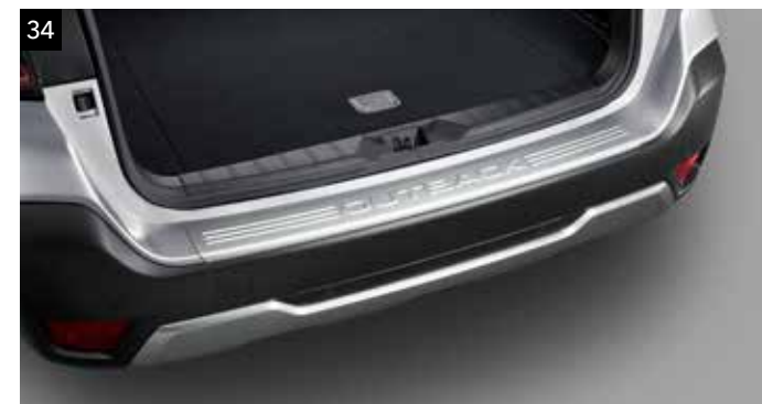
34 Protector zona de carga (resina con apariencia aluminio cepillado)