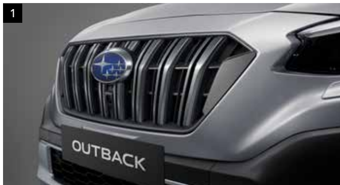
1 Rejilla frontal