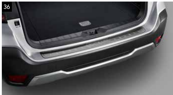
36 Protector zona carga paragolpes (acero)

Robusta cubierta de resina que ayuda a proteger la superficie superior del paragolpes.