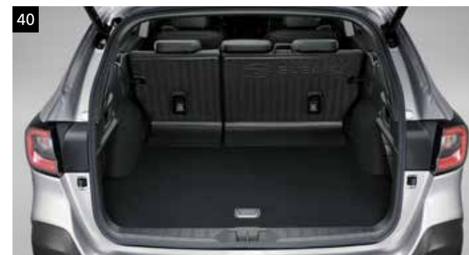
40 Protector asientos traseros

Protege el maletero de polvo y suciedad.