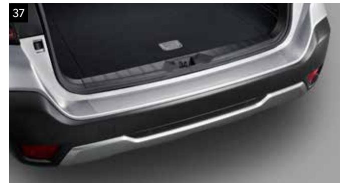
37 Lámina protección paragolpes trasero

Protege el paragolpes trasero de arañazos durante la carga/descarga.