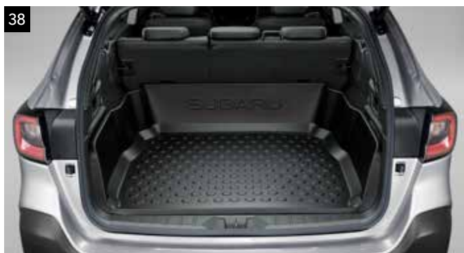
38 Protector maletero alto

Film transparente para proteger la superficie superior del paragolpes de arañazos.