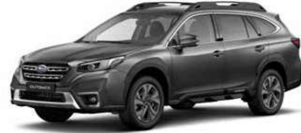
Magnetite Grey Metallic

DIMENSIONES ..... L. x An. x Al.: 4.870 x 1.875 x 1.675 mm MOTOR ..... Horizontalmente opuesto, 4 cilindros, DOHC 16 válvulas, gasolina CAPACIDAD ..... 2.498 cc POTENCIA MÁXIMA ..... 124 kW (169 CV) / 5.000 - 5.800 rpm PAR MÁXIMO ..... 252 Nm (25,7 kgfm) / 3.800 rpm TRANSMISIÓN ..... Lineartronic, AWD