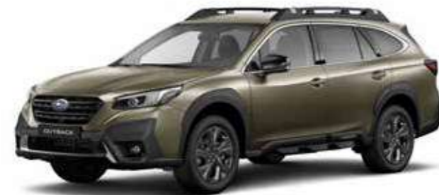
Autumn Green Metallic

DIMENSIONES ..... L. x An. x Al.: 4.870 x 1.875 x 1.670 mm MOTOR ..... Horizontalmente opuesto, 4 cilindros, DOHC 16 válvulas, gasolina CAPACIDAD ..... 2.498 cc POTENCIA MÁXIMA ..... 124 kW (169 CV) / 5.000 - 5.800 rpm PAR MÁXIMO ..... 252 Nm (25,7 kgfm) / 3.800 rpm TRANSMISIÓN ..... Lineartronic, AWD