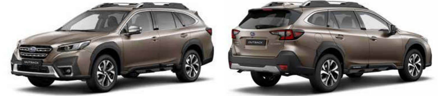
Brilliant Bronze Metallic

DIMENSIONES ..... L. x An. x Al.: 4.870 x 1.875 x 1.675 mm MOTOR ..... Horizontalmente opuesto, 4 cilindros, DOHC 16 válvulas, gasolina CAPACIDAD ..... 2.498 cc POTENCIA MÁXIMA ..... 124 kW (169 CV) / 5.000 - 5.800 rpm PAR MÁXIMO ..... 252 Nm (25,7 kgfm) / 3.800 rpm TRANSMISIÓN ..... Lineartronic, AWD