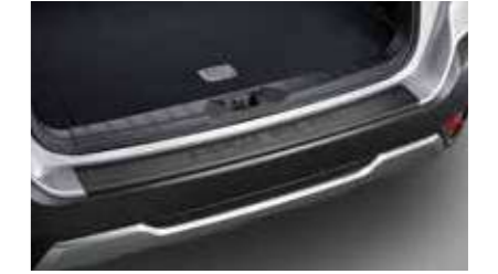
Protector de zona de carga