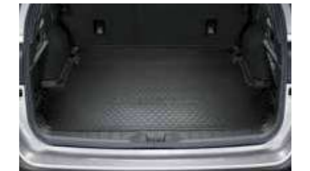
Protector de maletero