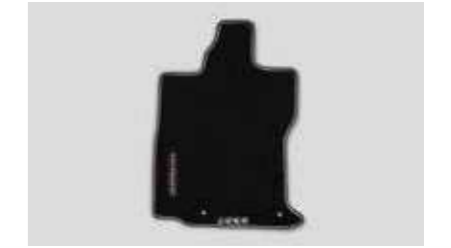
Juego de alfombras premium