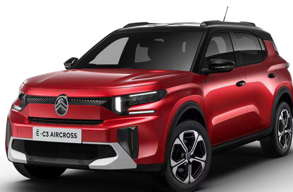
Rojo Elixir Techo Bitono Negro Perla Nera – Serie Opción