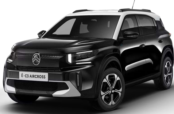
Negro Perla Nera Techo Bitono Blanco Natural – Serie Techo Color Carrocería – Opción Opción