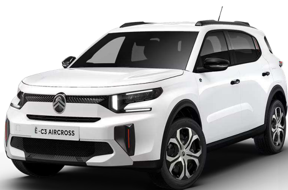
Blanco Polar Techo Color Carrocería – Serie Opción