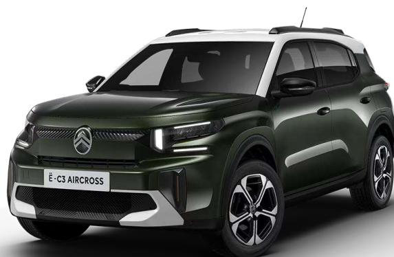
Verde Montana Techo Bitono Balnco Natural – Serie Opción