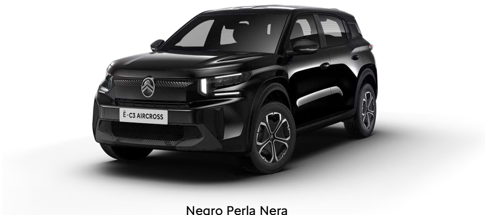
Negro Perla Nera Techo color carrocería Serie