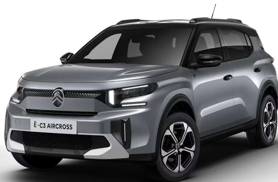
Mercury Grey Techo Bitono Negro Perla Nera – Serie Techo Color Carrocería – Opción Opción