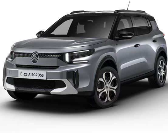
Mercury Grey Techo Color Carrocería – Serie Opción