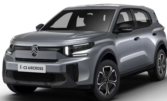
Mercury Grey Techo color carrocería Opción