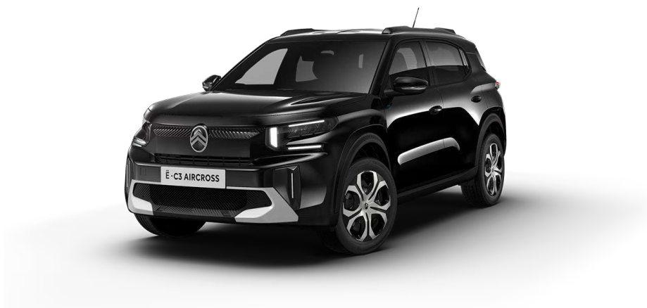
Negro Perla Nera Techo Color Carrocería – Serie Serie