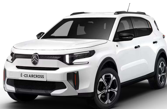
Blanco Polar Opción