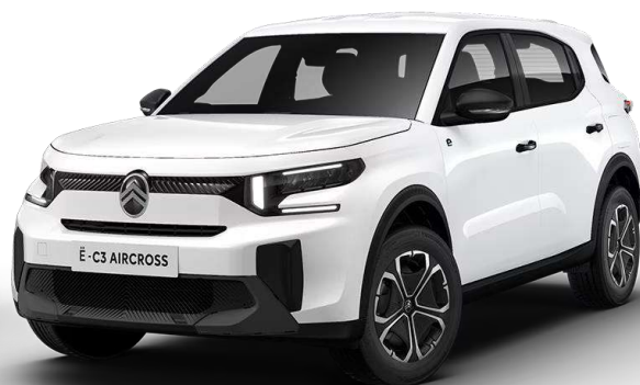
Blanco Polar Techo color carrocería Opción