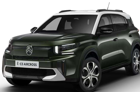
Verde Montana Techo Bitono Blanco Natural – Serie Opción