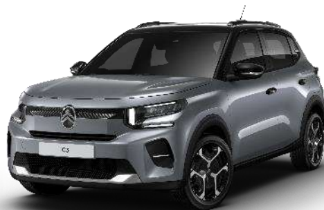
Mercury Grey Techo Color Carrocería - Opción Color Clip Blanco Polar Opción