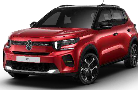
Rojo Elixir Techo Color Carrocería – Opción Color Clip Neon Lemon Opción