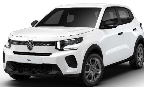
Blanco Polar Opción