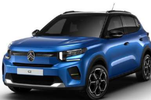
Azul Brillante Color Clip Neon Lemon Opción