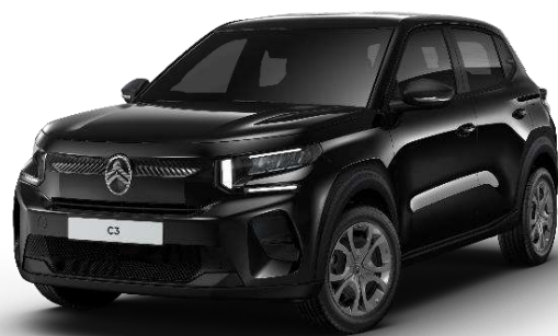
Negro Perla Nera Opción