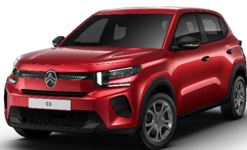
Rojo Elixir Opción