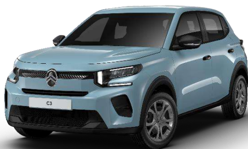
Azul Monte Carlo Color Clip Rojo André Serie