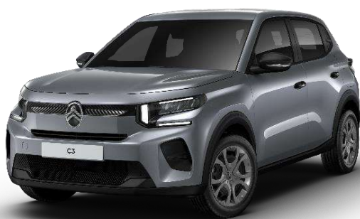
Mercury Grey Opción