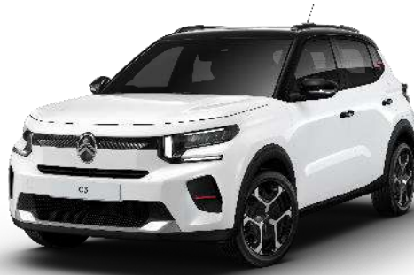
Blanco Polar Techo Color Carrocería – Opción Color Clip Rojo André Opción