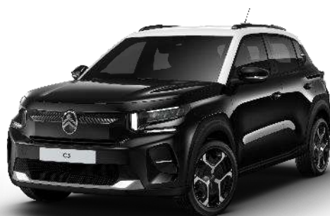
Negro Perla Nera Techo Color Carrocería - Opción Color Clip Blanco Polar Opción