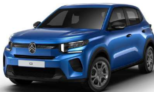
Azul Brillante Opción